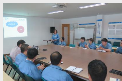
4月28日,八环公司召开2017年首次班组建设汇报会,对第一季度的班组建设工作进行了回顾。(大海)